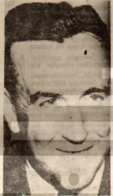
Chester Bowles Kulak verilecek ses