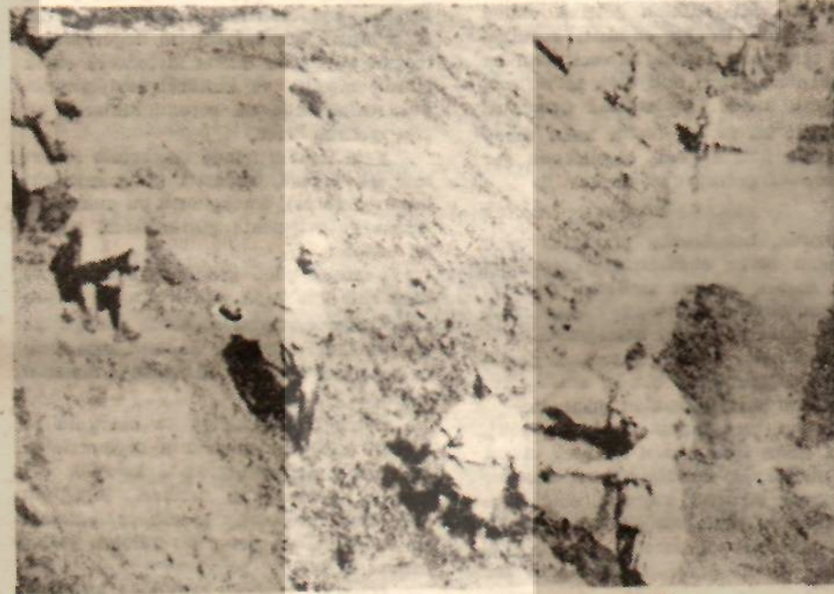
Sulama kanalı açma işinde çalışan Mısır köylüleri

Şunu daima hatırlamalıyız ki, insanın hür oluşu, onu mücadeleye iten en büyük etkidir.